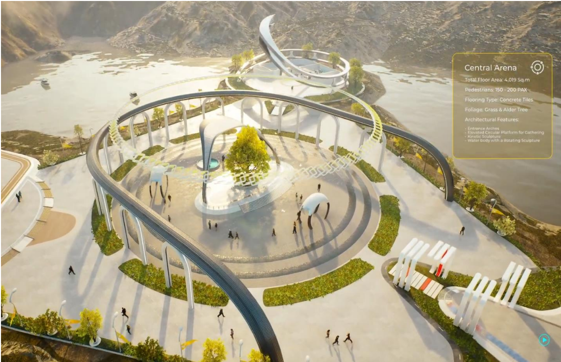
Space Era Unreal engine digital twin solutions