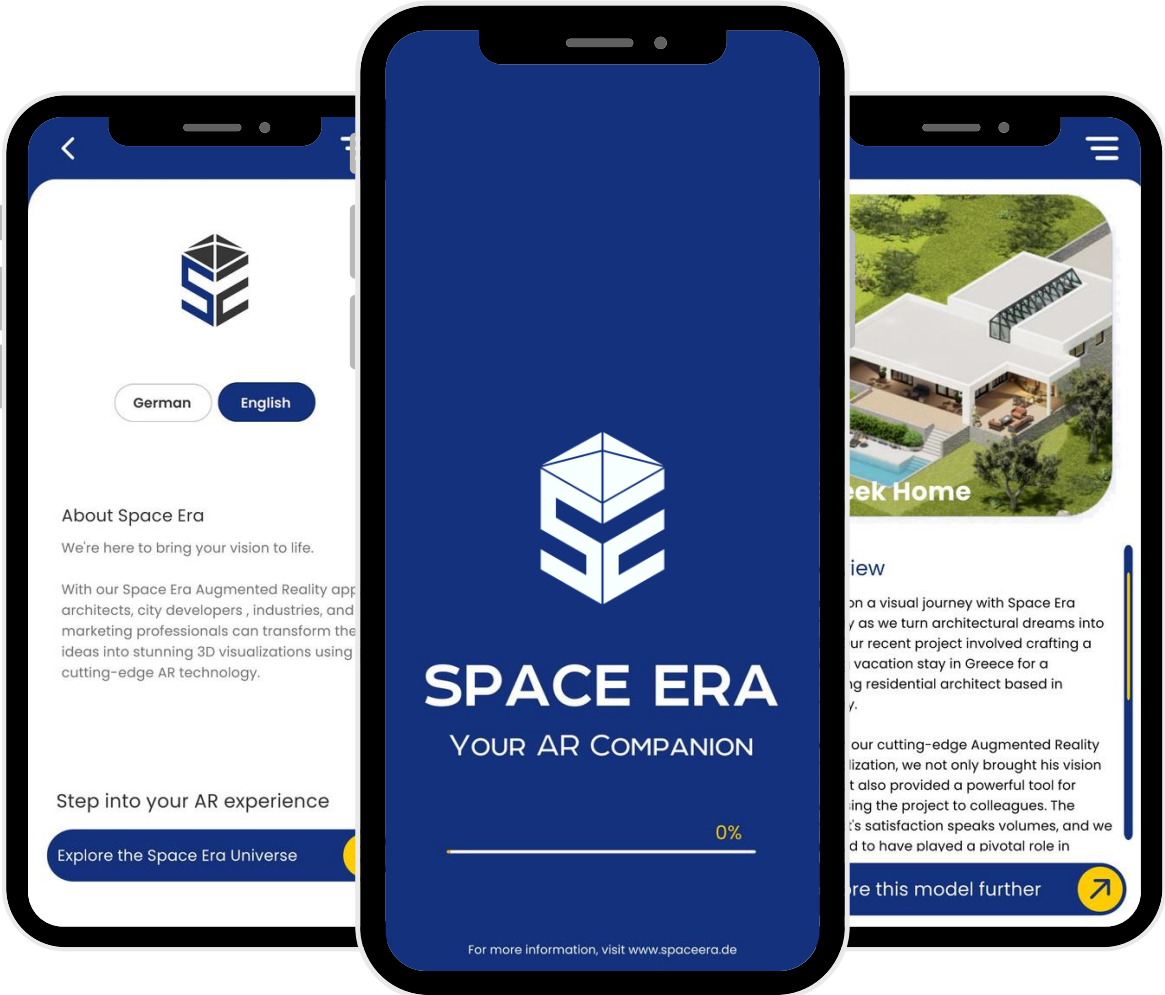
Space Era Augmented Reality (AR) App