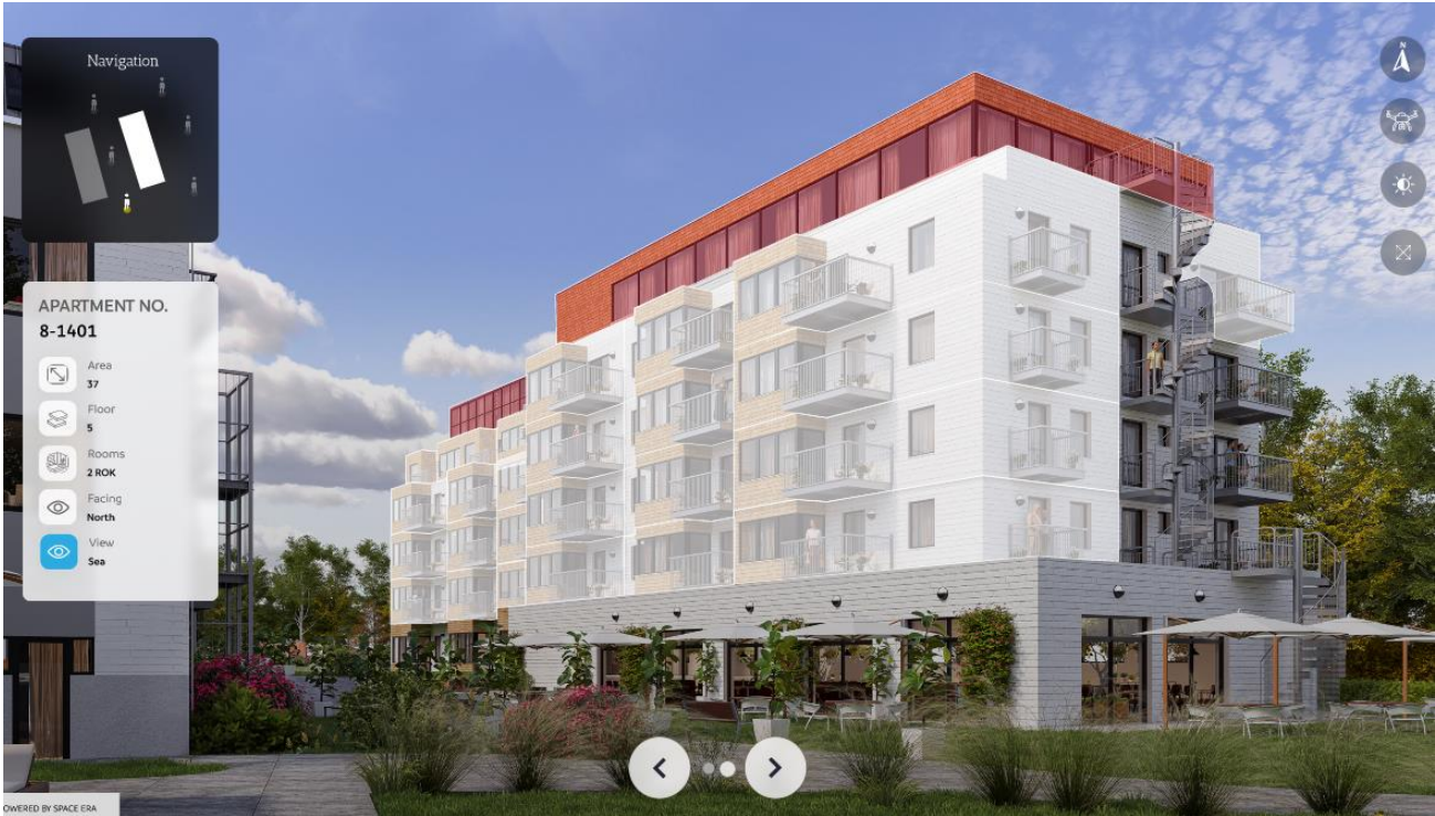
Space Era 3D Navigators